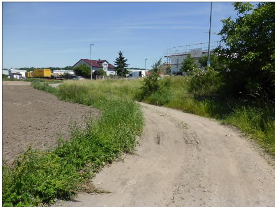
Abb. 8 Straßenböschung im Südosten an den Eingriffsbereich angrenzend, Blick nach Nordosten, 17.06.2021