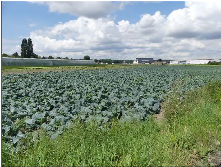
Abb. 5 Eingriffsbereich, Blick nach Norden, 05.08.2021