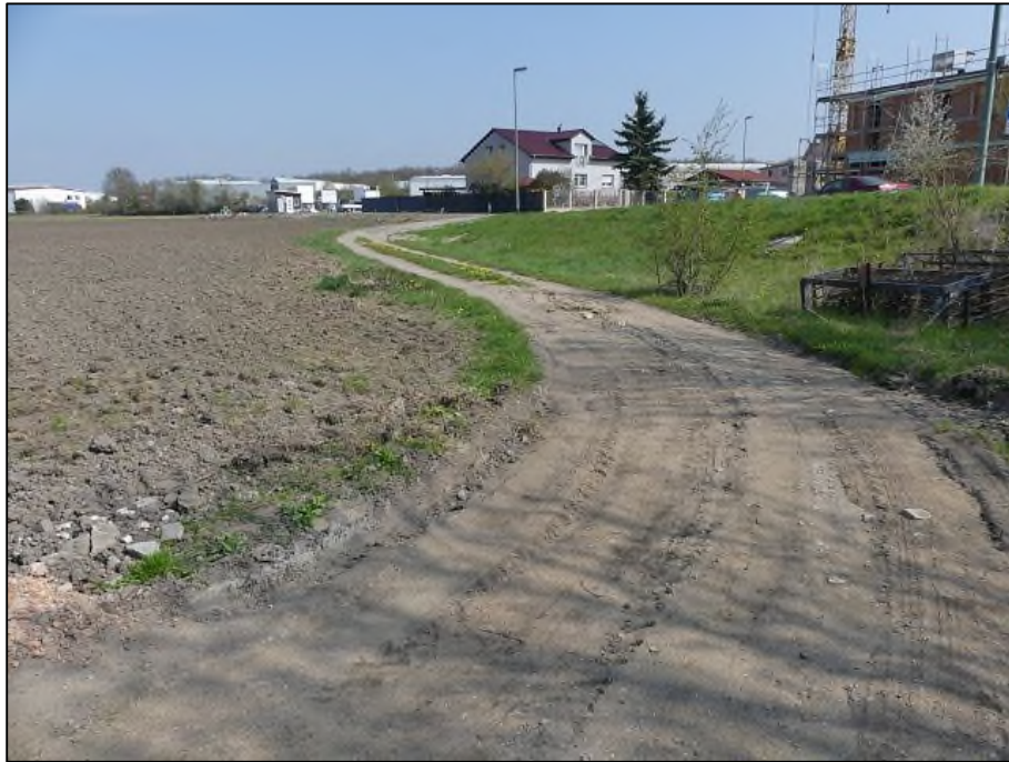
Abb. 7 Straßenböschung im Südosten an den Eingriffsbereich angrenzend, Blick nach Nordosten, 21.04.2021