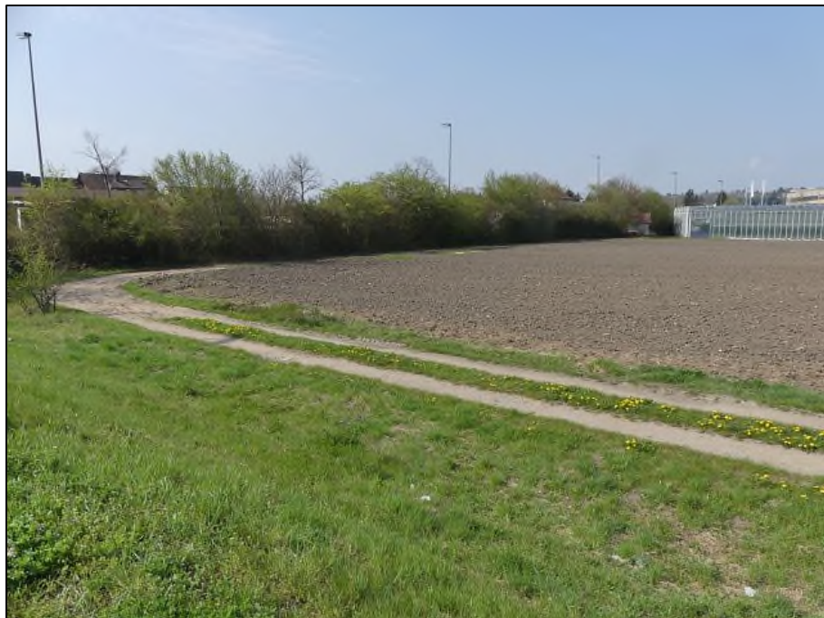
Abb. 6 Im Süden an den Eingriffsbereich angrenzende Hecke und Straßenböschung im Südosten, Blick nach Südwesten 23.06.2021