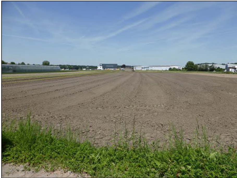
Abb. 3 Eingriffsbereich, Blick nach Norden, 17.06.2021