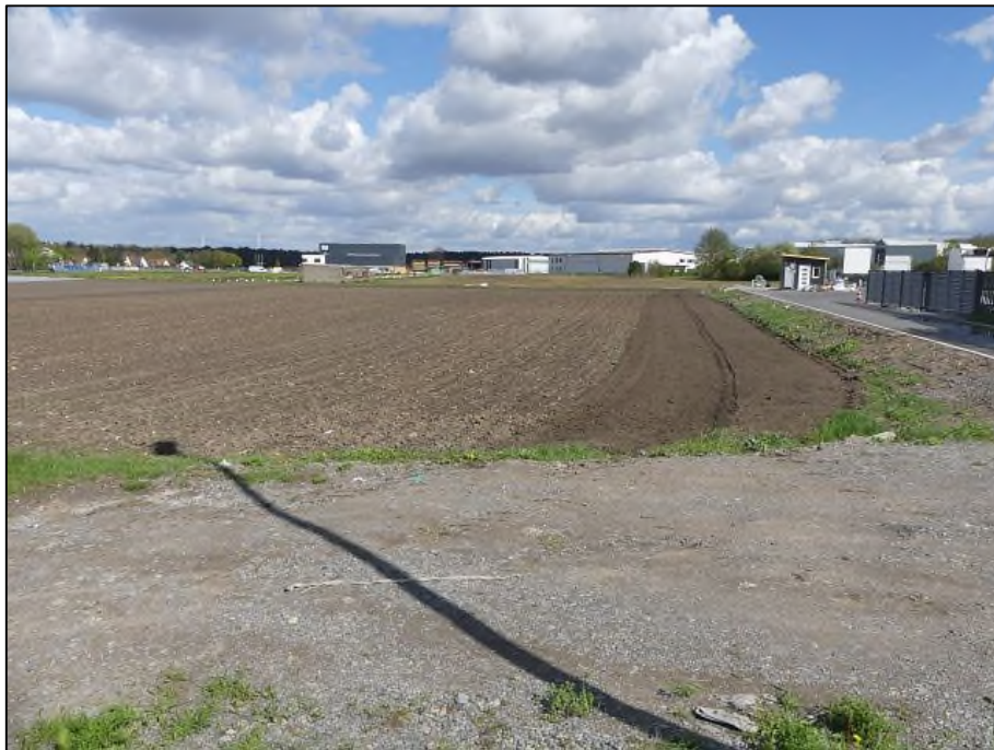
Abb. 4 Eingriffsbereich, Blick nach Norden, 05.05.2021