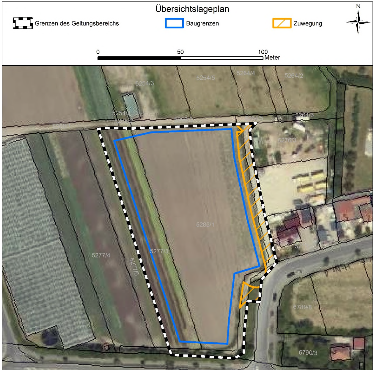
Abb. 2: Geltungsbereich und Baugrenzen